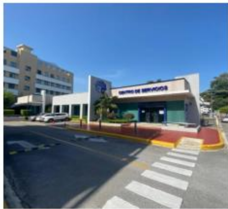
Centro de Servicios Lope de Vega

Dos edificaciones y centro de inspección especializado de vehículos que cuentan con 49 parqueos localizado Av. Lope de Vega Esq. Fantino Falco, Ens. Naco, Distrito Nacional. Su nivel de ocupación es de 100%