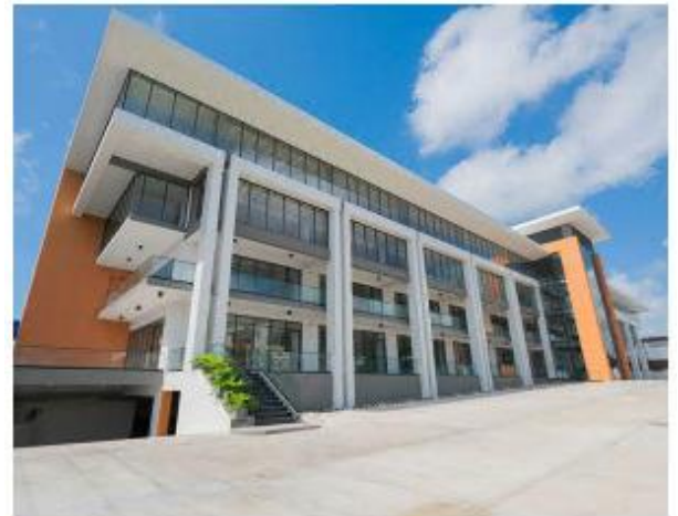
Edificio Galería 44

Dos edificaciones y centro de inspección especializado de vehículos que cuentan con 49 parqueos localizado Av. Lope de Vega Esq. Fantino Falco, Ens. Naco, Distrito Nacional. Su nivel de ocupación es de 100%