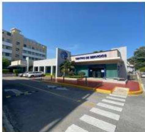
Centro de Servicios Lope de Vega

Dos edificaciones y centro de inspección especializado de vehículos que cuentan con 49 parqueos localizado Av. Lope de Vega Esq. Fantino Falco, Ens. Naco, Distrito Nacional. Su nivel de ocupación es de 100%