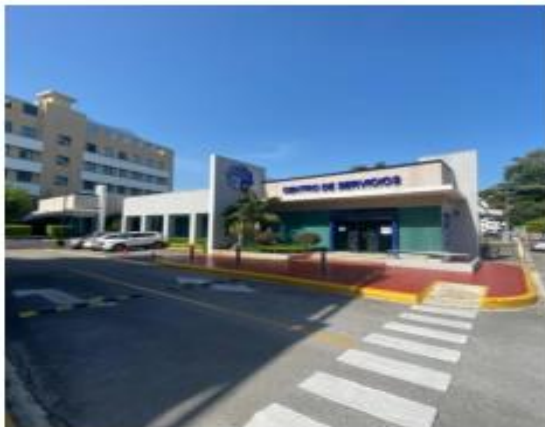
Centro de Servicios Lope de Vega

Edificio corporativo con área comercial de 2 pisos. Localizado en Carretera Mella N° 112, Las Palmas de Alma Rosa, Santo Domingo Este. Cuenta con un total de 1,596.66 mts 2 con 49 espacios de estacionamiento. Su nivel de ocupación es del 100%