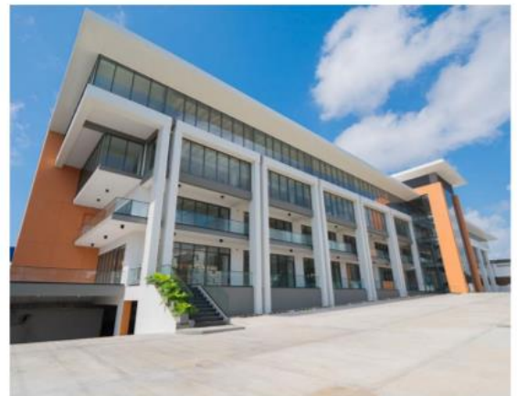
Edificio Galería 44

Dos edificaciones y centro de inspección especializado de vehículos que cuentan con 49 parqueos localizado Av. Lope de Vega Esq. Fantino Falco, Ens. Naco, Distrito Nacional. Su nivel de ocupación es de 100%